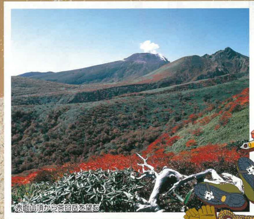
赤面山頂から茶臼岳を望む