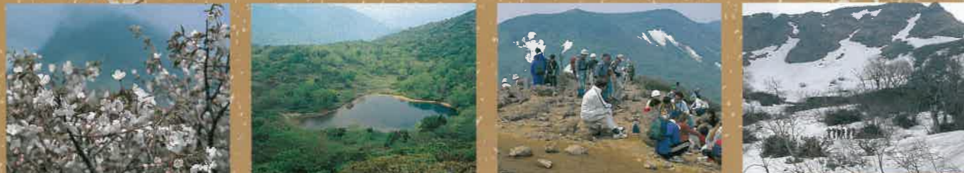
峰桜 鏡ヶ沼 赤面山頂 坊主沼周辺縦走